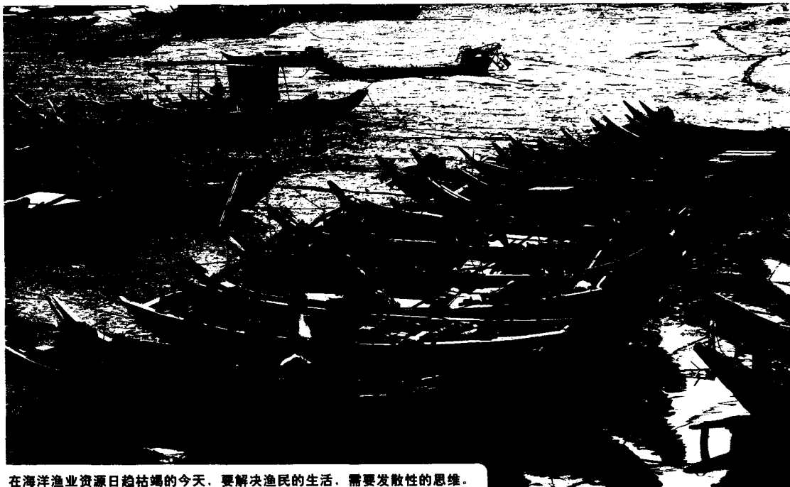
在海洋渔业资源日趋枯竭的今天，要解决渔民的生活，需要发散性的思维。

98 789 87567645735 46 5785 544563 234 654 4552 8575 54578164 44 7554632532 5 44 764845763 58 6687 578975 66 654637981637 246 456885615 5429555 78641856511 4645654235563 4326 44646525714 6641673565545 68 42 6 45657546 546 57 64 24 2832 8544 8754764 4574474 52415